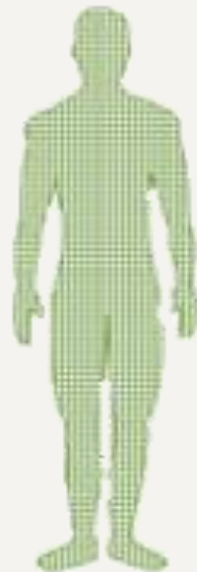
Cuerpo y órganos internos libres de estrés.