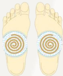
Círculos antiestrés en Plantas de los pies